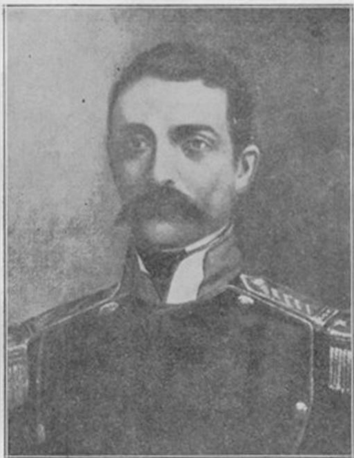
Ramón Matías Mella