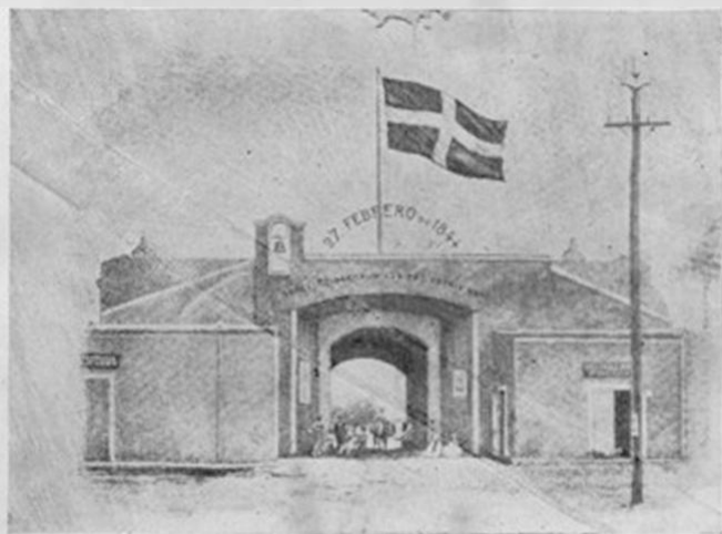
La Puerta de El Conde