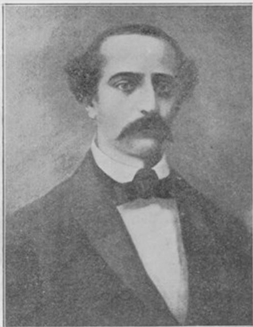
Juan Pablo Duarte