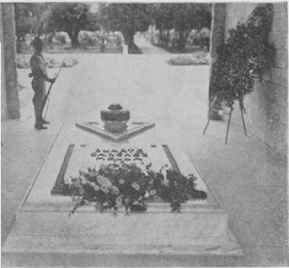
Tumba de los Padres de la Patria