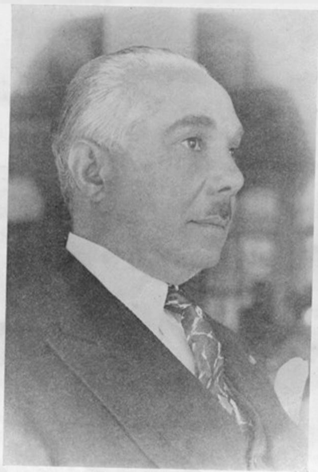
Generalísimo Doctor Rafael L. Trujillo, Benefactor de la Patria y Hon. Presidente de la República.