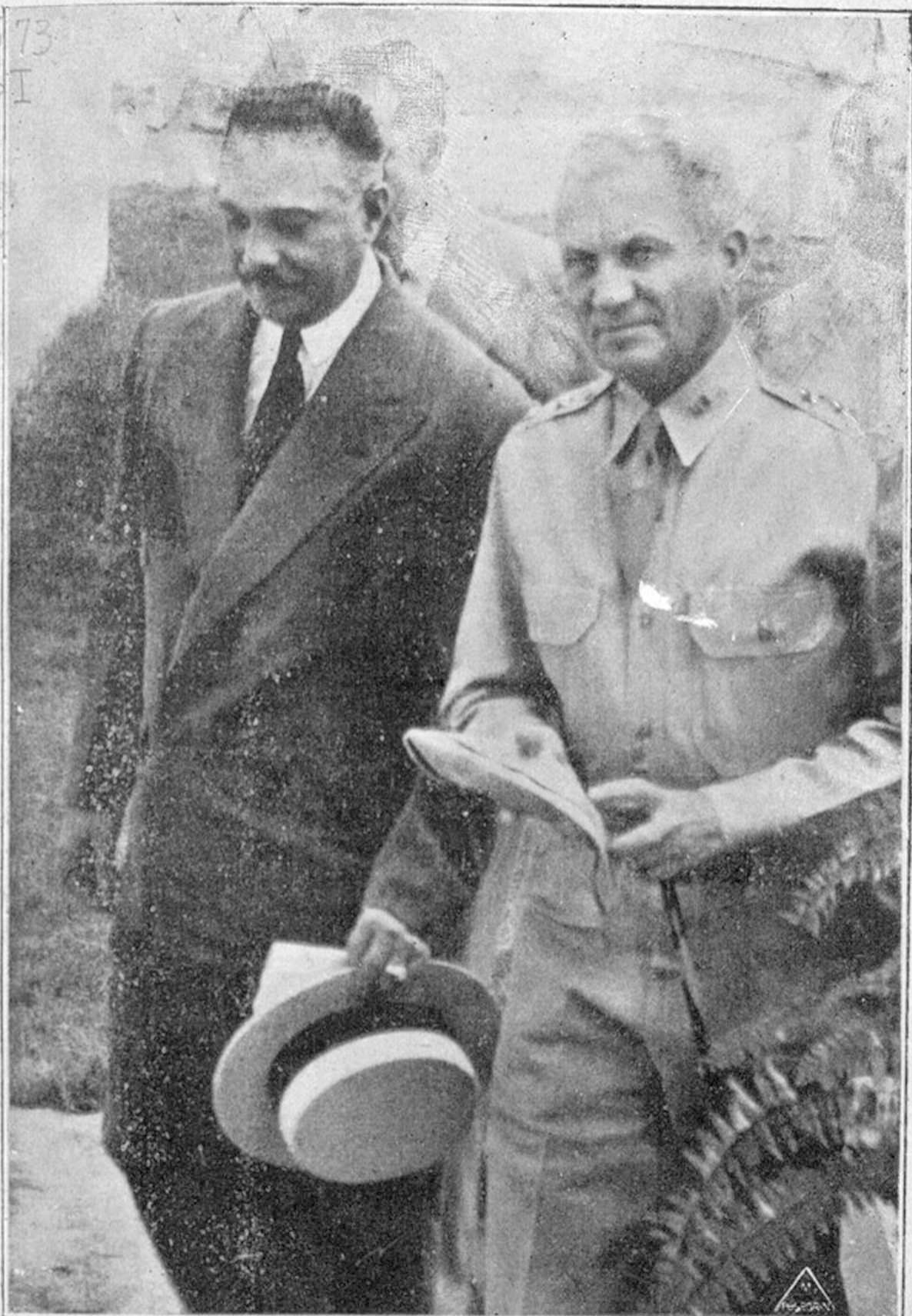
El Honorable Presidente Trujillo y el Teniente General Frank Maxwell Andrews