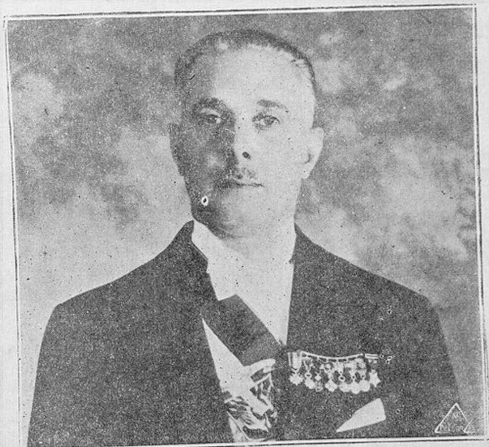
Generalísimo Doctor Rafael L. Trujillo Molina, Benefactor de la Patria y Jefe Supremo y Director del Partido Dominicano.