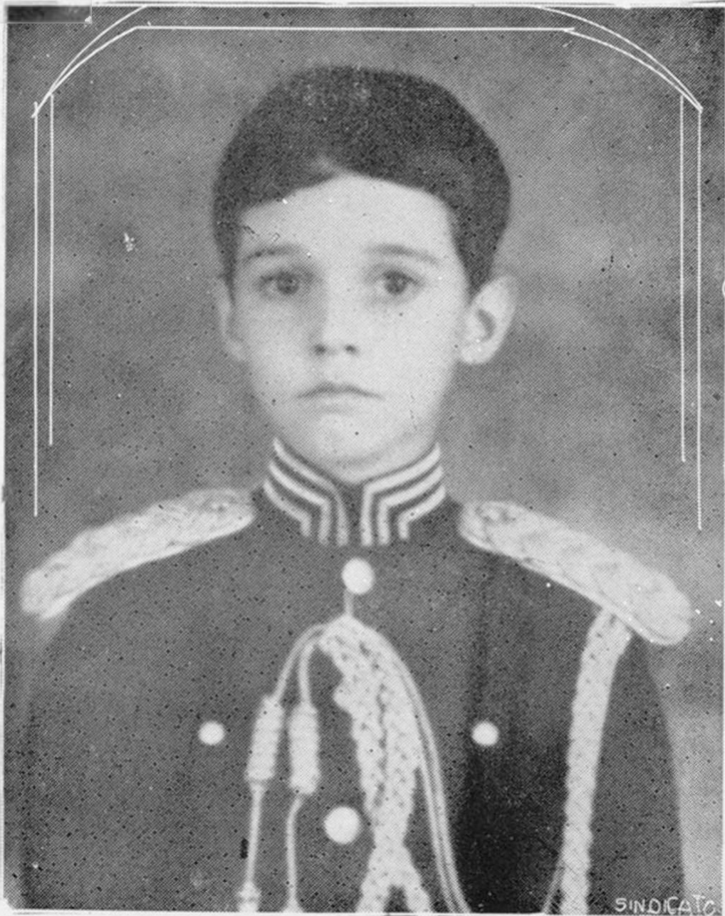
General Rafael L. Trujillo Martínez, Presidente de Honor del Partido Trujillista.