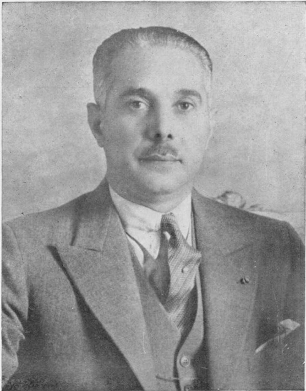
Generalísimo Doctor RAFAEL LEONIDAS TRUJILLO MOLINA, Benefactor de la Patria, Jefe Unico del Partido Trujillista.