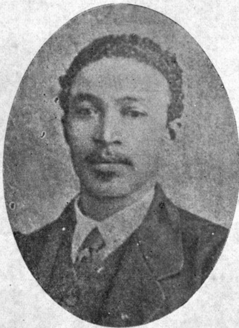
GENERAL GREGORIO LUPERON