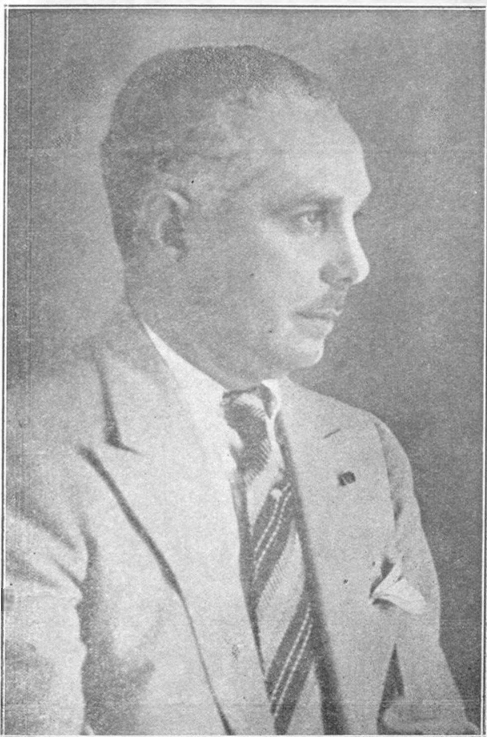
Generalísimo Doctor RAFAEL LEONIDAS TRUJILLO MOLINA, Benefactor de la Patria Honorable Presidente de la República