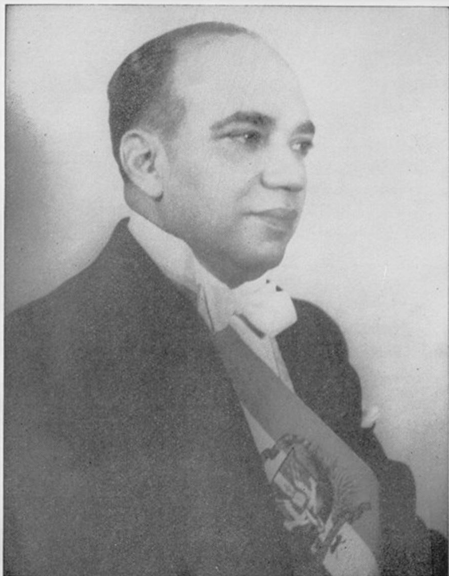
General Héctor Bienvenido Trujillo Molina, Excelentísimo Señor Presidente de la República.