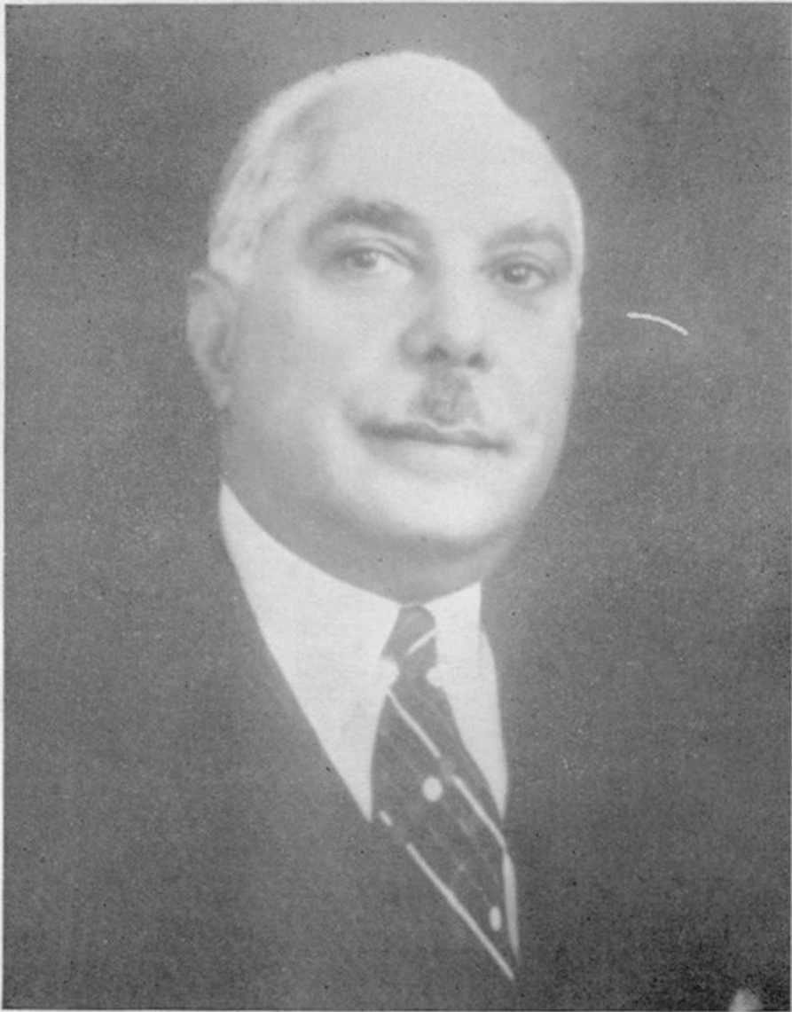
Generalísimo Doctor Rafael Leonidas Trujillo Molina, Ilustre Benefactor y Padre de la Patria Nueva.