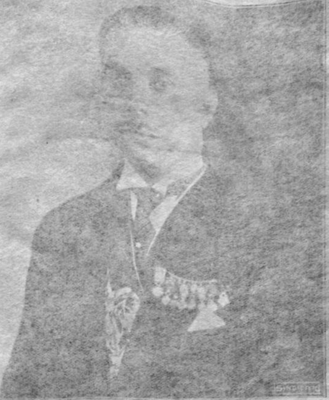
Generalísimo Doctor Rafael Ángel Trujillo Molina, El más ilustre Señor Presidente de la República. Restaurador de la Independencia y Benéfico de la Patria.