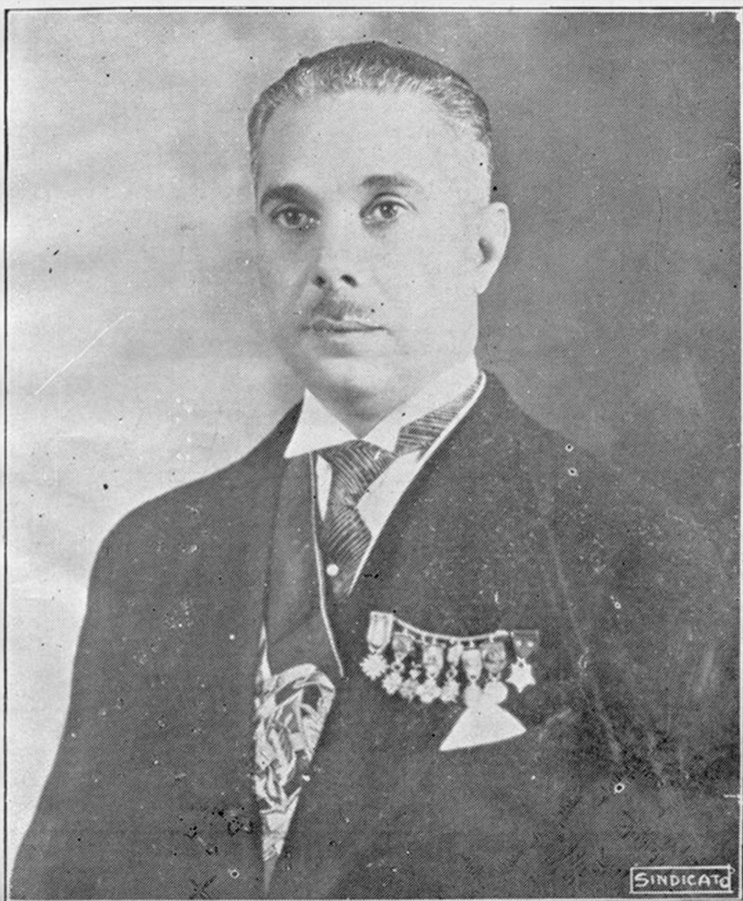
Generalísimo Doctor Rafael Leonidas Trujillo Molina, Excelentísimo Señor Presidente de la República, Restaurador de la Independencia Financiera y Benefactor de la Patria.