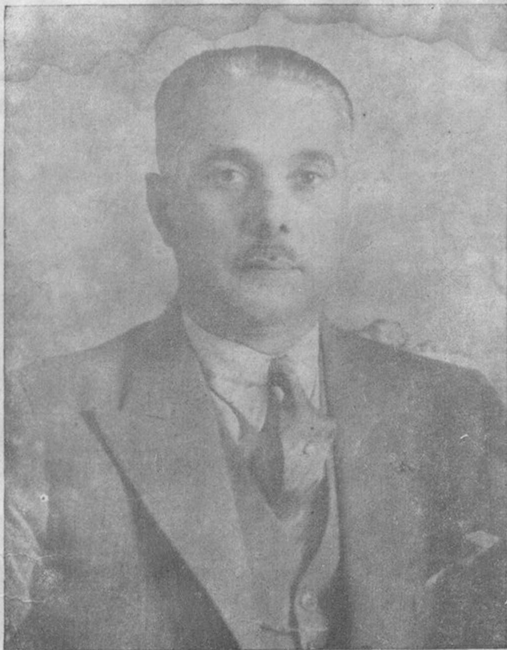
GENERALISIMO DOCTOR RAFAEL L. TRUJILLO MOLINA Benefactor de la Patria, Jefe Supremo, y Director del Partido Dominicano.